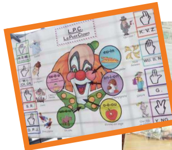
Codeurs Langue Parlée Complétée