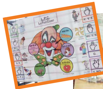
Codeurs Langue Parlée Complétée