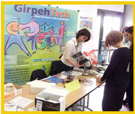
GirpehTech : information, diagnostic, prêt de matériel