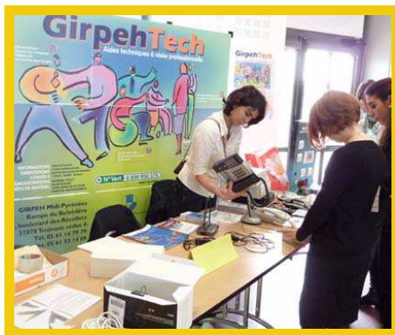
GirpehTech : information, diagnostic, prêt de matériel