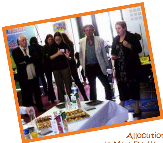
Allocution de Mme Dedébat