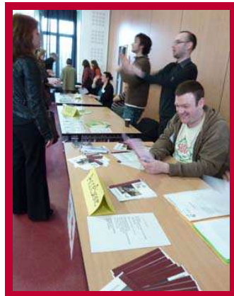
AST (Association des Sourds de Tolosa), Visuel et Accessible : formation et services d'interprétation en Langue des signes Française